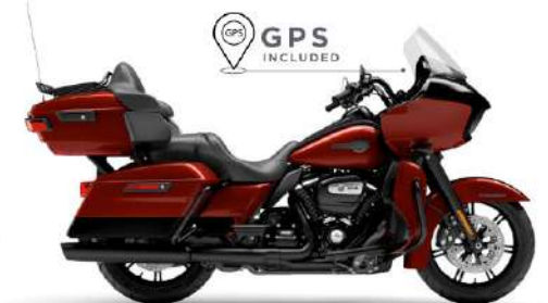
ROAD GLIDE ULTRA