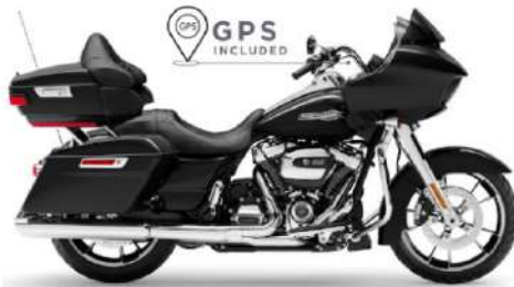
ROAD GLIDE TOURING