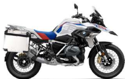
R 1250 GS