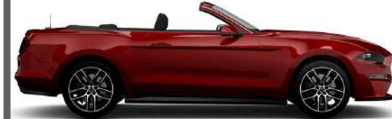
FORD MUSTANG CABRIO O SIMILAR