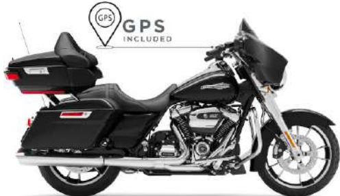
STREET GLIDE TOURING