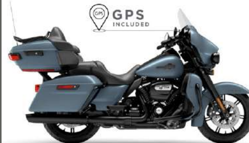
ELECTRA GLIDE ULTRA